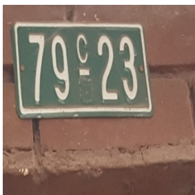
FOTOGRAFÍA 1. PLACA DEL PREDIO