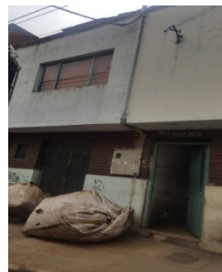
FOTOGRAFÍA 2. FACHADA DEL PREDIO