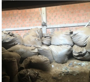
FOTOGRAFIA N°. 5 AREA DE ALMACENAMIENTO